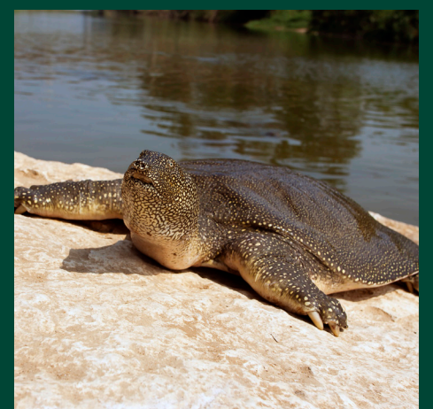
צב רך.

חיות בר התמחו בקיום ובשגשוג בטבע. בואו נשמור על יכולתן, על כושרן ועל חושיהן הטבעיים וניזהר שלא להפוך אותן לתלותיות ונזקקות. עכשיו זה ברור: מפסיקים להאכיל את חיות הבר!